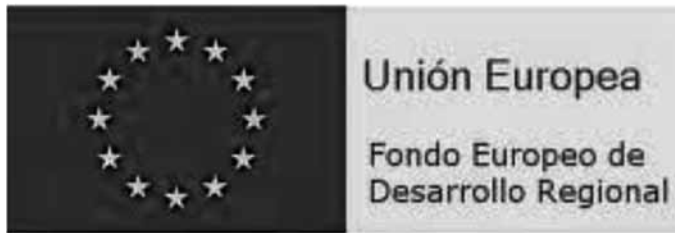
"Una manera de hacer Europa"

En nuestro país, este tema está siendo extensamente utilizado por los