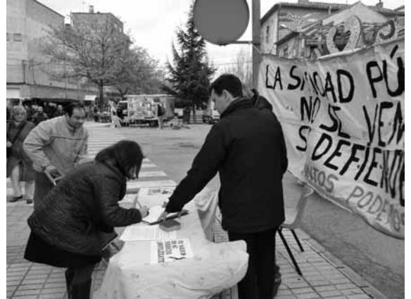
Comenzó la recogida de firmas a favor de la sanidad pública en el mercadillo.