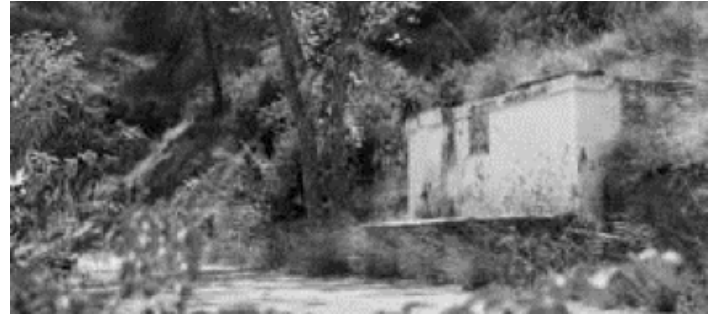
La fuente Nueva, a 705 metros sobre el nivel del mar, fue la primera en sufrir el descenso del nivel freático y se secó en torno a 2001.

Al igual que Quinciano, no provienen de familia hortelana, pero siempre han sentido un cariño especial por estos espacios. Hace 25 años, compraron un terreno en Los Benitillos, un antiguo caserío junto a la desbordante Rambla del Agua. Diez años después, el manantial se secó y las vecinas y vecinos tuvieron que hacer nuevas conducciones de agua desde otros nacimientos. "¿Cuánta agua no vendría, para haber ahí un molino! La goma