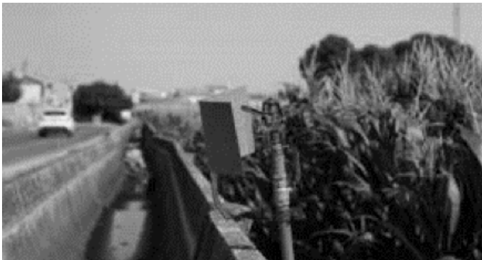
Un aspersor junto a una antigua acequia de riego por inundación, en un maizal de Albacete.

La última vuelta de tuerca en el modelo agrícola de Castilla-La Mancha empezó hace diez años: los tradicionales cultivos de secano (viña, almendro, olivar...) iniciaron la conversión a regadío. La situación ha cambiado hasta tal punto que la mitad del viñedo, una quinta parte del almendro y una sexta parte del olivar de la región, se cultivaron de regadío en 2018, según el Ministerio de Agricultura, Pesca y Alimentación.