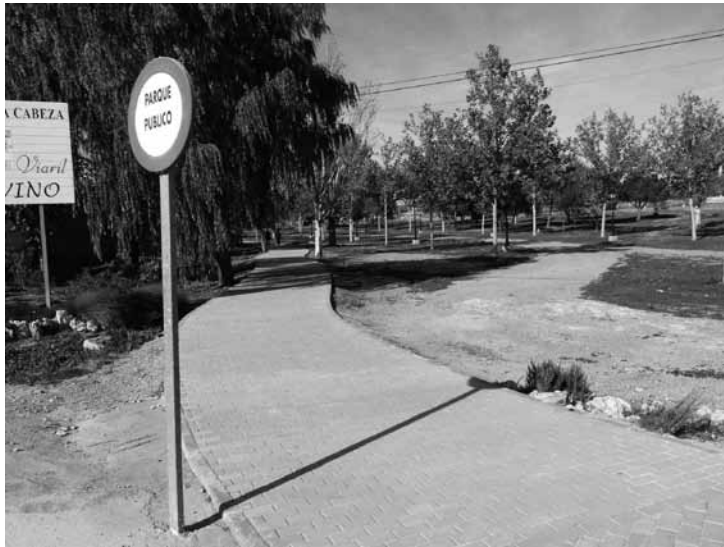
Una de las actuaciones será el desbrozar y reponer tierra en el Parque de las Dos Hermanas

En la plaza de toros se tapanán las fisuras que la acción de las heladas, lluvia y nieve del pasado invierno ha afectado al estado de las gradas. En el centro de adultos se repararán y repondrán elementos de carpintería, instalaciones y acabado que hayan quedado en mal estado por el uso, de modo que la planta baja pueda destinarse a la enseñanza de adultos. Hay que recordar que para el próximo curso está previsto el traslado de la guardería, que actualmente ocupa estas instalaciones, a