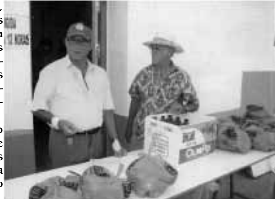
Repartiendo patatas y aceite para el concurso de "Patatas al montón"

Una vez que los terrenos pertenecían al pueblo, el pensamiento que tenían ambas mujeres se puso en práctica y no era otro que plantar árboles y arbustos y actualmente ya se puede ver un parque en marcha que va mejorando cada año porque se están haciendo muchas reformas como por ejemplo el carril-bici que se ha inaugurado este año que arranca desde la plaza de toros hasta la carretera