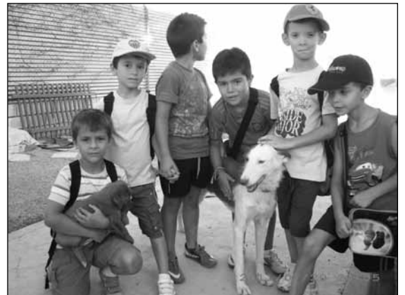
El verano infantil en El Refugio

Nuestro día a día consiste principalmente en cuidar, alimentar y prestar la asistencia sanitaria necesaria a los animales que en ese momento se encuentran en "El Refugio", bien porque alguien los ha dejado allí, o bien porque los hemos encontrado después de que los hayan abandonado sus dueños. Es una labor costosa en tiempo y recursos, que no sabemos hasta cuándo podremos seguir realizando.