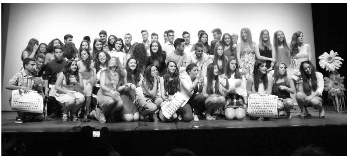
El 17 de junio, graduación de los alumnos de Educación infantil en el Teatro

Este próximo curso, con la entrada en vigor de la LOMCE en la ESO, está previsto que se cambien los libros para los alumnos de primero y tercero. Próximamente está previsto que salga la convocatoria de ayudas para las familias, añade el director.