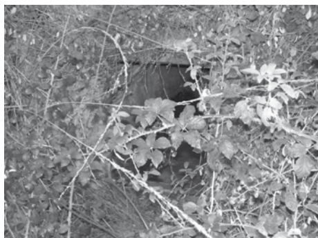
Vista exterior de la mina (17-10-2010)