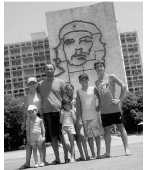
La familia al completo en la Plaza de la Revolución de La Habana: "Hasta la victoria siempre".

De todos los paisajes que hemos visto, nos quedamos con el humano. Hombres, mujeres, niños y niñas que nos han acogido y querido como si fuéramos de los suyos. Con la sonrisa en los labios y la palabra amable en la boca. Porque Cuba, ahí al lado, es otro mundo, donde la gente vive y se organiza de otra forma, con sus virtudes y sus limitaciones, pero sin dejar a nadie tirado en la cuneta. Apostando por la cultura y la satisfacción de las necesidades básicas de la gente (aunque sea compartiendo las escaseces), con unos servicios públicos que garantizan la sanidad y la educación universal.