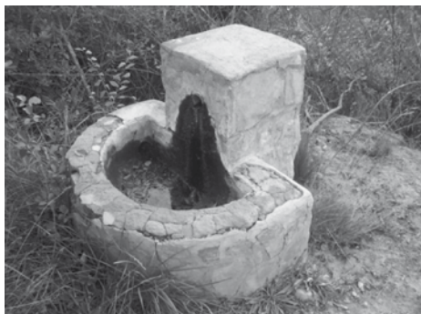
Detalle del caño y pilón de la fuente (17-10-2010).