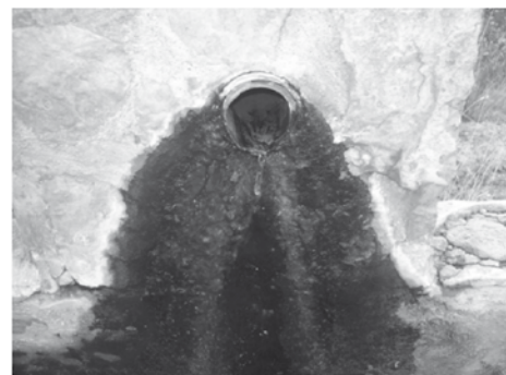
Detalle del caño (17-10-2010)

Caudal medio actual real (17-10-2010): 0,014 l/s