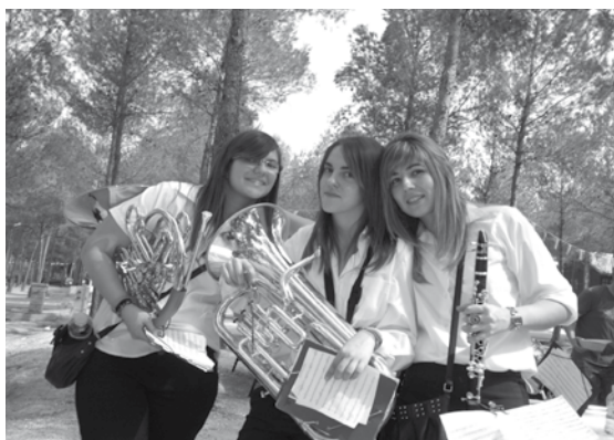
Miembros de la UMI en la inauguración de las casitas del balneario de la Concepción en Villatoya

Una vez más gritemos todos a una ¡¡QUE VIVA SANTA CECILIA!!