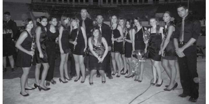
Miembros de la UMI en el concierto con bailarines en la plaza de toros la feria pasada.

22 de noviembre, día en que SANTA CECILIA nació. Y es por ello que en estas fechas la banda de nuestro pueblo, la UNION MUSICAL IBAÑESA, al igual que tantas otras agrupaciones musicales, celebra la festividad de su patrona. Las celebraciones comenzaron el sábado día 19 por parte de los alumnos/as de la escuela de música. Por la mañana se tras-