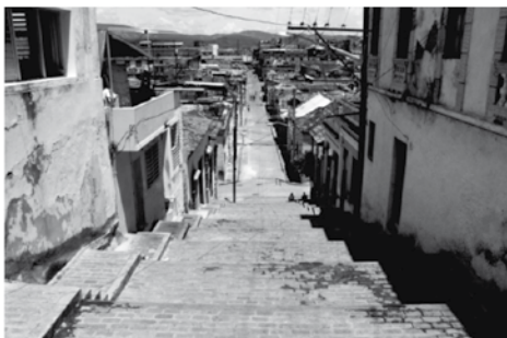
Las escalinatas de Padre Pico, la entrada al Barrio del Tivoli.

viendo en la calle Padre Pico, muy cerca de las escalinatas más famosas de la ciudad y a tiro de piedra de la bahía y del centro histórico, en la misma entrada al barrio del Tivoli. A este barrio llegaron los hacendados franceses con sus esclavos desde el vecino país de Haití, cuando en 1789 la Revolución Francesa abolió la esclavitud en los territorios franceses. Entonces Haití pertenecía a Francia, y las plantaciones de caña de azúcar y de café utilizaban mano de obra esclava para maximizar los beneficios. Total, que se vinieron para Cuba a continuar sus negocios, pues en esta isla española por aquel entonces, la esclavitud era una actividad completamente legal. Nuestro barrio en tiempos fue morada de esclavos, de negros/as africanos/as que fueron arrancados de su tierra para ser vendidos como una mercancía más. No era pues de extrañar, que en esta tierra de gente sedienta de libertad, machacada y humillada, nacieran las revoluciones más bellas de América.