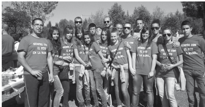
Miembros de la UMI de comida en la Virgen de la Cabeza.

diversas corales, orquestas, bandas y cantantes la festejan en su fiesta. Hoy existen por todas partes las sociedades de "cecilianos" (asociaciones musicales que llevan su nombre). Fue SANTA CECILIA una ilustre doncella romana que se convirtió en una de las primeras mártires de la historia de la cristiandad. Vivió en el s. III y cuenta la historia que desde pequeña a menudo se la veía tañendo instrumentos musicales. También que llegada la época de su juventud y a pesar de haber consagrado su virginidad a Jesucristo, fue prometida por sus padres a un joven caballero, con el cual y por no oponerse a la voluntad de sus padres, celebró boda bajo las leyes romanas. Según cuentan las actas SANTA CECILIA fue arrestada por propagar la fe cristiana y se le exigió que renunciara a la religión de Cristo. Ella declaró que prefería la