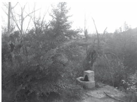
Vista general de la fuente (17-10-2010)

Altitud fuente (m.s.n.m): 686 Coordenadas UTM fuente: X 631668 Y 4354839