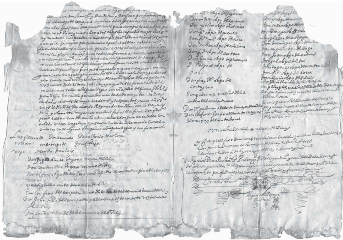
Copia del privilegio alfonsino configurando el término de Jorquera con sus aldeas.