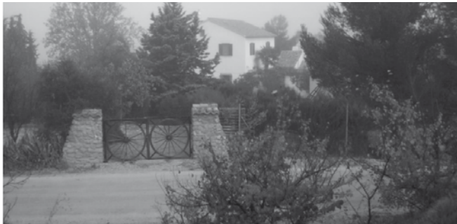
Vivienda de la Huerta del Francés (06-11-2010).

Vivienda. La huerta cuenta con una gran casa rehabilitada en los años 80 del siglo XX que se encuentra en buen estado de conservación.